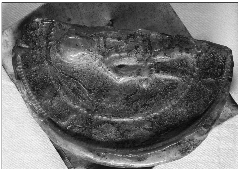
Il. 2. Pieczęć Władysława Hermana, księcia polskiego (1079–1102), przywieszona na odwrociu dokumentu bez miejsca i daty wystawienia z końca XI w. lub początku XII w. [ok. 1095–4 czerwca 1102] (Bamberg, Staatsarchiv, Bamberger Urkunden, nr 145).

bamberskiej kapituły katedralnej z 6 maja 1093 (BU 143) 45 . Bardzo zbliżona promulgacja jak w dokumencie Hermana występuje jednak w notycji darowizny alodium przez biskupiego ministeriała Fryderyka dla ołtarza św. Piotra w katedrze bamberskiej z drugiej połowy XI w. („Notum sit omnibus Christi fidelibus tam posteris quam modernis 46 ”), znana m.in. z kopii w sporządzonym przez kustosa Udalryka zbiorze listów i dokumentów, dedykowanym w 1125 r. biskupowi wüzburgskiemu Gebhardowi ( Codex Udalrici ) 46 . Ponadto w dokumencie Władysława Hermana Rupert jest wymieniony jako siódmy biskup bamberski, a zwyczaj numerowania ordynariuszy znany jest z wcześniejszych dokumentów i notycji biskupich (BU 108, 116, 122) 47 . Na specjalną uwagę zasługuje szczególnie paleograficzny, mianowicie imię Gumpona, wysłannika kanoników i biskupa bamberskiego, zostało najpierw zapisane tylko w postaci sygła G., a następnie nadpisane tą samą ręką w trzecim wierszu w postaci